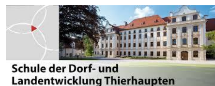
Schule der Dorf- und Landentwicklung Thierhaupten

Das LAG-Management wird gefördert durch das Bayerische Staatsministerium für Ernährung, Landwirtschaft und Forsten und den Europäischen Landwirtschaftsfonds für die Entwicklung des ländlichen Raumes (ELER)